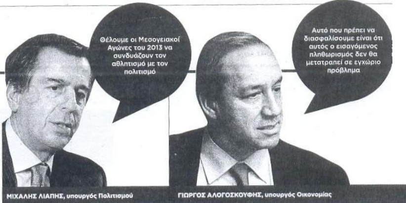
ΜΙΧΑΗΛΗΣ ΛΙΑΣΗΣ, υπουργός Πολιτισμού

Τα Λουτρά Απολλωνίας επισκέφθηκε χθες ο υπουργός Μακεδονίας-Θράκης Μαργαρίτης Τζίμας, συνοδευόμενος από τον νομάρχη Παναγιώτη