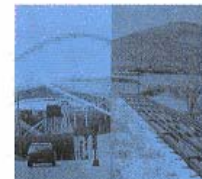
Παράλληλη συγκριτική παρουσίαση ελευσέρη Το στέγητρο του αρχ. Σ. Καλοσορού στο Ακρωτήρι Σαντορίνης για το στέγητρο στο Ακρωτήρι Σαντορίνης, εκμ. Η. Φουκαδάκης Εξομολόγηση: Από το αρχείο του αρχ. Β. Καλοσορού στη Βιβλιοθήκη του ΣΑΔΑΣ με τη βοήθεια της εταιρείας Σπασίδη