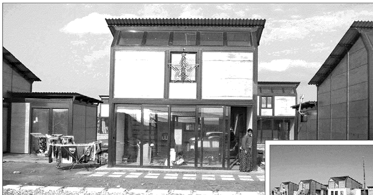
Ο Βιοκλιματικός Οικισμός την εποχή που πρωτοεγκαταστάθηκαν οι σκηνίτες αθιγγανοί του δήμου Μενεμένης Θεσσαλονίκης. Μέσα σε πέντε περίπου χρόνια μετατράπηκε στην εικόνα που βλέπουμε στην ένθετη φωτογραφία, παραπήγματα που χάνονται μέσα σε βουνά σκουπιδιών και λασπομένους χωματόδρομους.

Ο δήμος Μενεμένης φιλοξενεί πολλούς Αθιγγάνους στην περιοχή του Δενδροποτάμου, η οποία απασχολεί συχνά τον Τύπο για περιπτώσεις παραβατικότητας. Τη δεκαετία του '90 αλλά και σήμερα στις παρυφές του Δενδροποτάμου -και του οικισμού Αθιγγάνων Αγ. Νεκταρίου- υπήρχαν έντονα προβλήματα «από ορισμένους θύλακες παραπηγματούχων που "ενοχλούσαν" την αστική ανάπτυξη, τον πολεοδομικό σχεδιασμό και την εφαρμογή της ρυμοτομίας που η δημοτική αρχή είχε προσπαθήσει να υλοποιήσει στην περιοχή προκειμένου για την ενσωμάτωση των καταυλιγμένων Αθιγγάνων στο πολεοδομικό σχέδιο»,