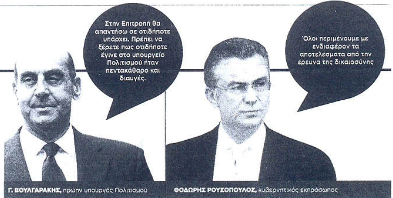
Γ. ΒΟΥΦΑΡΑΚΗΣ , πρώην υπουργός Πολιτισμού

Μπορεί στη Θεσσαλονίκη να μην έχουν ροζ άνδρα και ροζ συνομιλίες, όμως κάποιοι λένε ότι υπάρχουν μαγνητοφωνημένες σε κινητό τηλέφωνο οι βαριές... κουβέντες του επικεφαλής κρατικής εταιρείας σε συνδικαλιστή. Έτσι λένε.